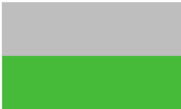
Gambar 2. Warna Sampul Proposal Magang

Proposal Magang dan laporan magang dicetak pada kertas HVS ukuran A4 (210 mm x 297 mm) dengan berat 70 gsm. Pencetakan dilakukan pada satu sisi kertas ( print one sided ) atau tidak dicetak bolak-balik ( print on both sided ). Untuk Gambar, Grafik, Diagram, Flowchart dan Tabel dapat dicetak berwarna . Halaman sampul proposal magang dicetak pada kertas Omega warna abu-abu muda dengan tinta hitam. Sementara itu, sampul laporan magang dicetak pada kertas Omega warna hijau daun dengan tinta hitam.