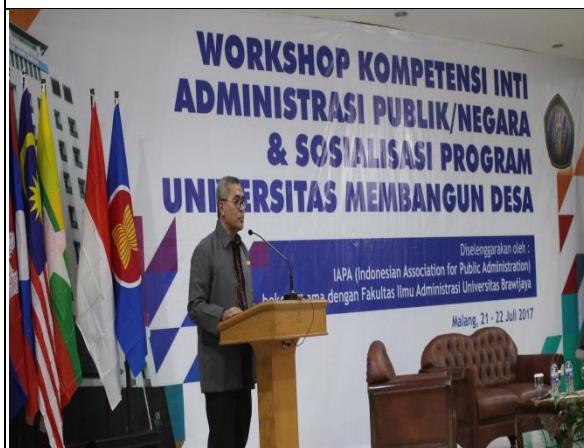
Workshop Kompetensi Inti Administrasi Publik/Negara & Sosialisasi Program Universitas Membangun Desa