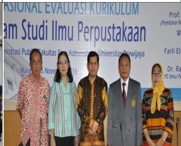
Workshop Nasional Evaluasi Kurikulum Program Studi Ilmu Perpustakaan