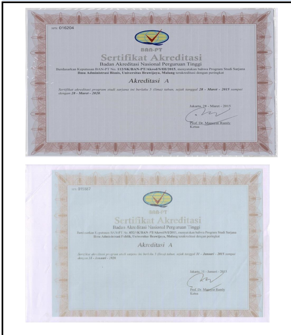
Gambar 4. 5 Contoh Beberapa Sertifikat Akreditasi BAN PT