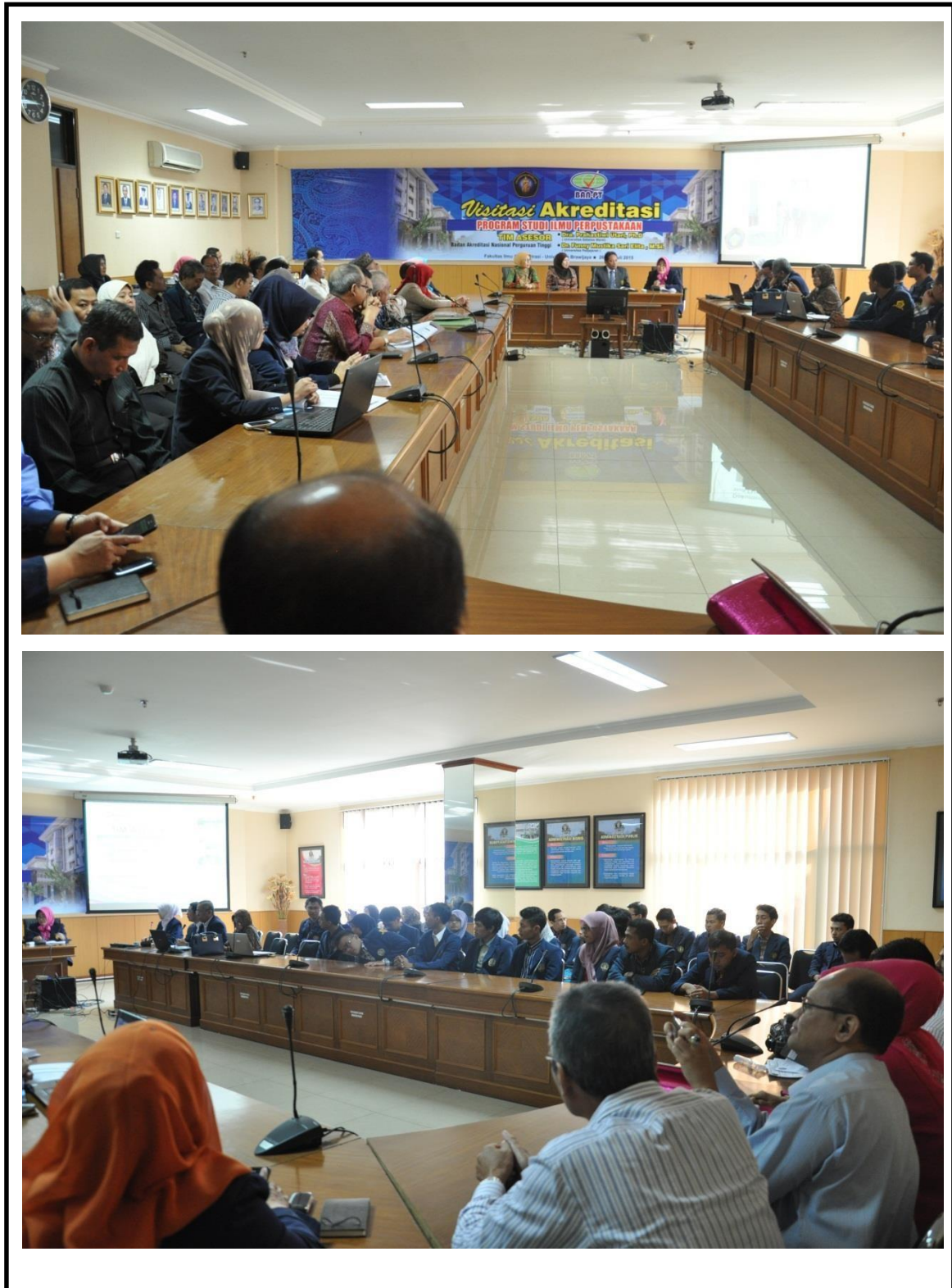
Gambar 4. 6 Pelaksanaan Visitasi Akreditasi Prodi S1 Ilmu Perpustakaan & S1 Pariwisata