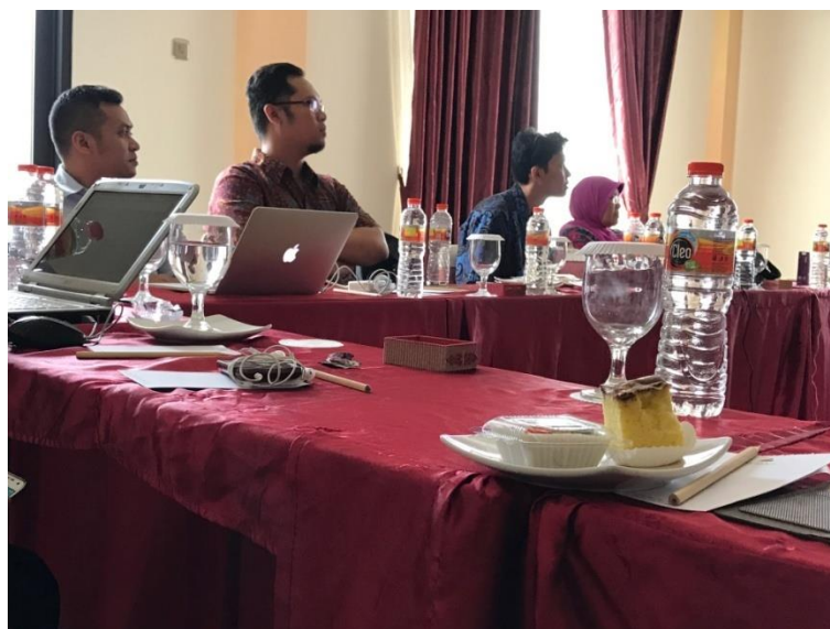
Gambar 4. 4 Konsinyering pengisian dokumen akreditasi IACBE Jurusan Administrasi Bisnis/Niaga

Pada tahun 2017 ini pula, Program Studi S1 Administrasi Pendidikan dan Program Studi S3 FIA Kampus Jakarta sedang mengajukan Akreditasi Baru. Pada saat ini berada pada tahap penyusunan Borang Akreditasi yang diajukan di Badan Akreditasi Nasional Perguruan Tinggi (BAN PT). Penyusunan borang akreditasi tersebut mencakup penyusunan borang