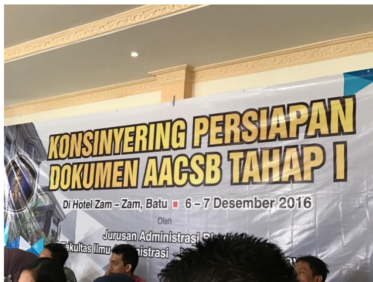
Gambar 4. 3 Konsinyering pengisian dokumen akreditasi AACSB Jurusan Administrasi Bisnis/Niaga

International pada IACBE. Sampai dengan saat ini progress yang dicapai adalah berada pada tahap pengisian dokumen akreditasi tersebut. Jurusan Administrasi Bisnis selain itu menyiapkan pula pengisian Dokumen Akreditasi untuk mendapatkan Akreditasi dari The Association to Advance Collegiate Schools of Business (AACSB) .