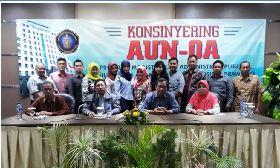
Gambar 4. 1 Konsinyering pengisian dokumen akreditasi AUN QA Jurusan Administrasi Publik/Negara