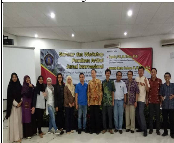
Seminar dan Workshop Penulisan Artikel Jurnal Internasional: Inside the Publish or Perish Phenomenon