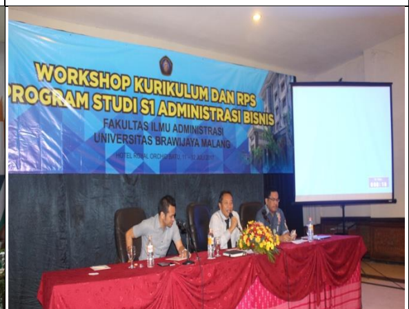
Workshop Kurikulum dan RPS