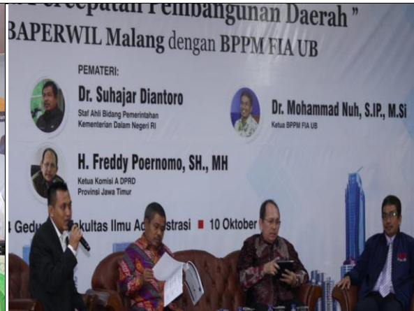
Workshop Reformasi Peran dan Fungsi Badan Koordinasi Wilayah dalam Rangka Percepatan Pembangunan Daerah